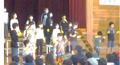
マスクをしての表現

※アンケートのご協力ありがとうございました。課題など集計して次年度の発表会に活かしていきます。