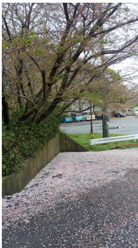
(夜須中学校トレセン前)

ものごとは、一面からだけ見るのではなく、いろいろな角度から見れば、また、違った味わいもあるものだと思えて感じさせられました。